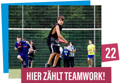
HIER ZÄHLT TEAMWORK!